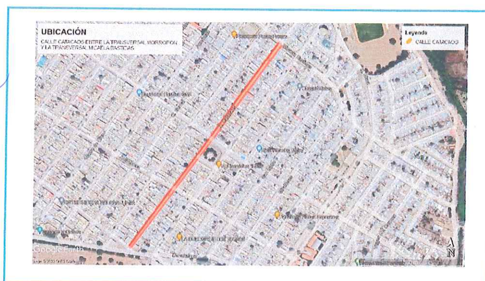
Gráfico 02: Localización del proyecto Elaboración propia