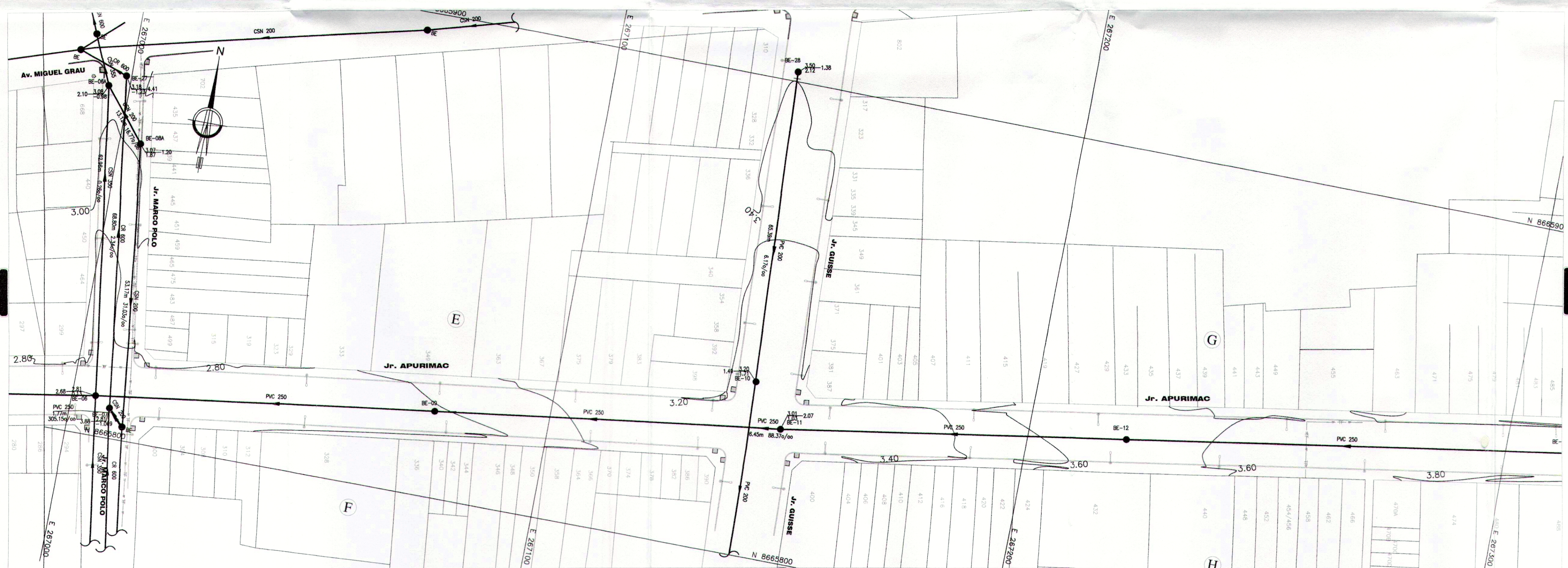
PLANTA ESC 1:500

PLANO : REDES DE ALCANTARILLADO EXISTENTES LÁMINA : ALCE-01 FECHA : NOVIEMBRE 2019 ESCALA : INDICADA