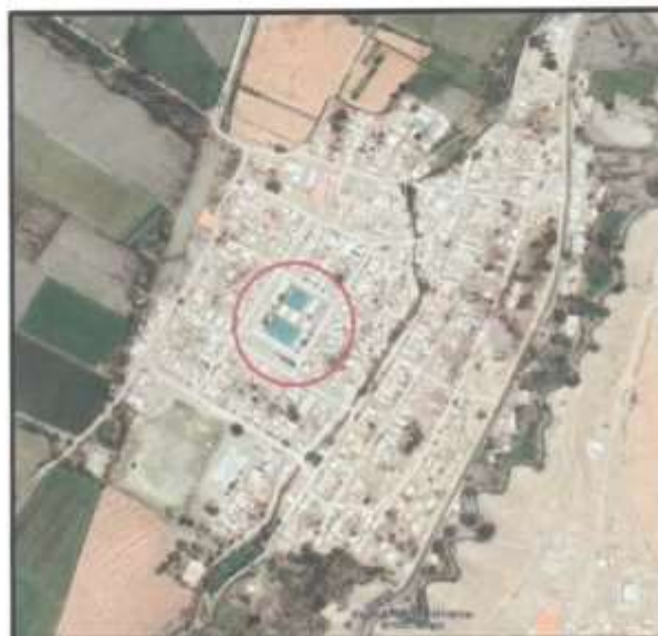
GRÁFICA 02: Localización