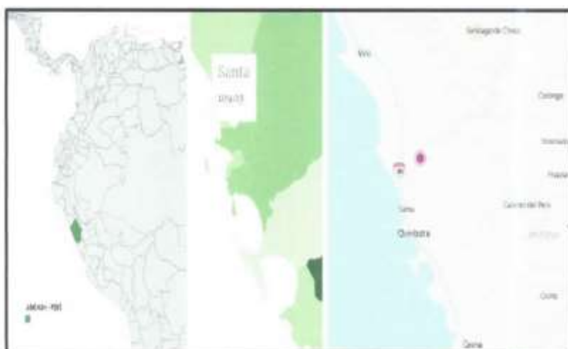
GRÁFICA 01: Ubicación

La Institución Educativa N° 88330 - Vinzos, se encuentra ubicado en las siguientes coordenadas UTM WGS84 17S: