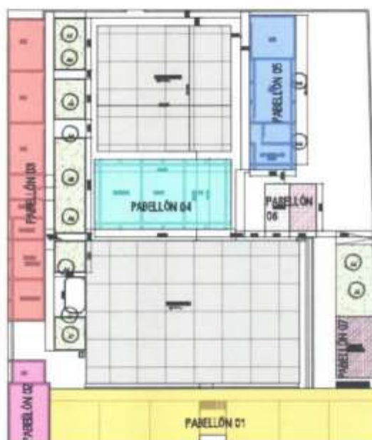
GRÁFICA 03: Pabellones existentes