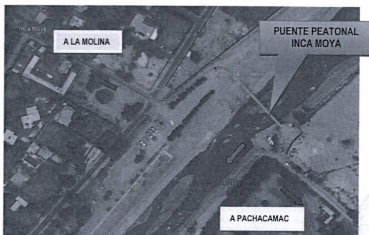
Vista Área de la ubicación del Puente Inca Moya

Las siguientes son las características del puente y de los accesos proyectados: