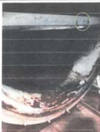
Se observa el refractario deteriorado y la estructura metálica fisurada