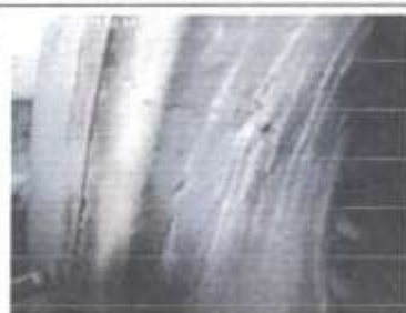
Se observa grietas en las capas del block refractario

HDAC HOSPITAL REGIONAL DANIEL ALCIDES CARRIÓN CIP-1707394