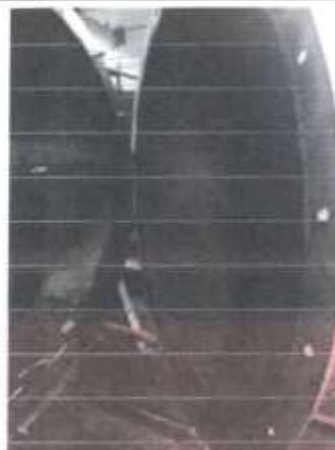
Como se aprecia, el refractario requiere un nuevo revestimiento