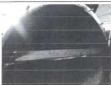
El soporte metálico debe ser reforzado con soldadura