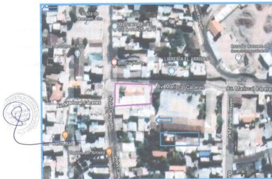
Imagen satelital (Google Earth) del proyecto - (I.E.I N° 106 - Carmen Alto)

Micro localización del área de influencia- ubicación del distrito de Carmen Alto.