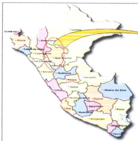
En el país

Zona : 18M Este : 338092 E Norte : 9223455 S