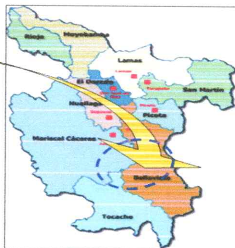
En la región.