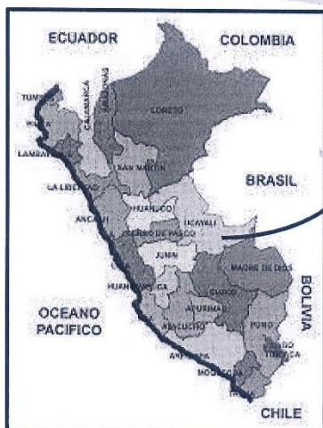
MAPA DEL PERU