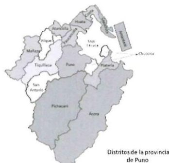
Distritos de la provincia de Puno