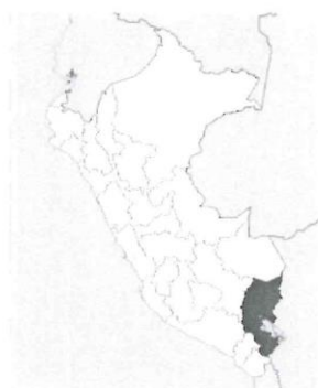
Ilustración 6: Mapa macro de la localización del Perú