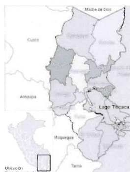
Ilustración 7: Mapa del departamento de Puno