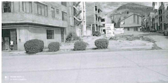
Ilustración 9: Foto tomada desde Av. Residencial

urbanista de la zona y mitigar la contaminación que se produce debido al polvo y suciedad presente en los espacios sin pavimentar y con poco mantenimiento.