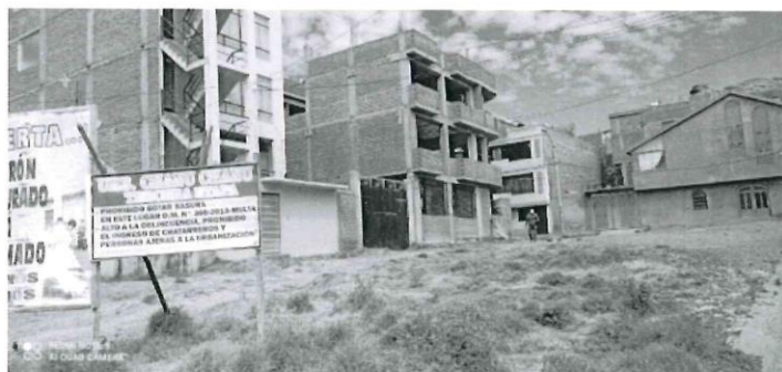
Ilustración 11: Foto tomada desde intersección de Av. Residencial y Calle S/N

Ademas se ha destinado un espacio para el ejercicio al aire libre, incentivando la practica de ejercicio en los jovenes del lugar y propiciando los distintos usos en el espacio de recreacion, dando oportunidad a la integracion de jovenes y pequeños.