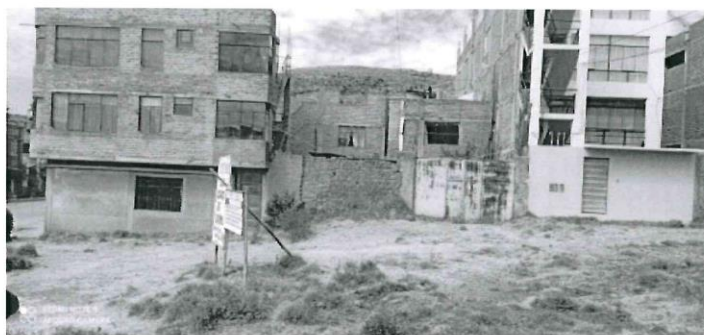
Ilustración 10: Foto tomada desde Calle S/N