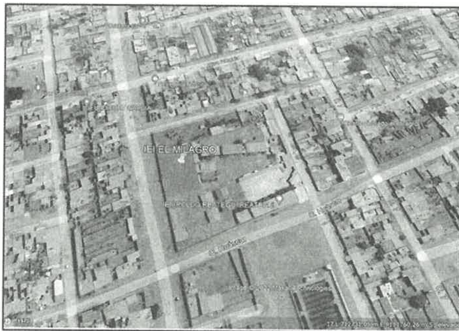
Figura 3: Ubicación de la IE