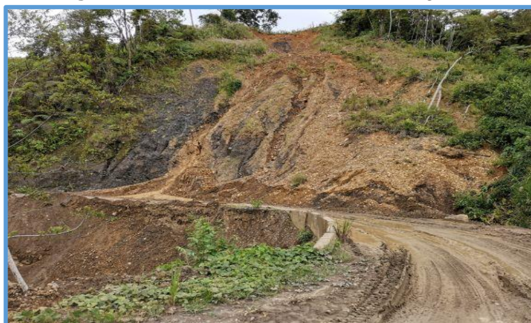
Fotografía N° 05: Cantera de afirmado Prog. 05+400