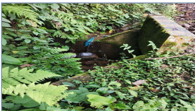
Fotografía N° 5: Cunetas cobertura con maleza

Son canales abiertos construidos lateralmente a lo largo de la carretera, con el propósito de conducir los escurrimientos superficiales y sub-superficiales procedentes de la plataforma vial, taludes y áreas adyacentes a fin de proteger la estructura del pavimento. En la vía en estudio se encontraron cunetas colmatadas de tierra, piedra, maleza u otros elementos que no permite su funcionamiento. La falta de estos elementos de drenaje la formación de surcos de erosión en la vía.