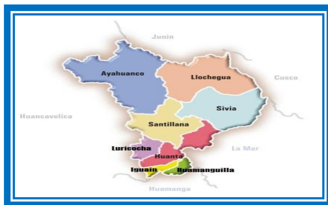
Cuadro N°03: Localidades del área de influencia de la actividad