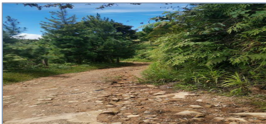
Afloramiento de piedras Ø 6"-8" en forma de cabezas duras

Las plazoletas de cruce son secciones ensanchadas de una carretera de un solo carril, destinada a facilitar el adelantamiento o el volteo del tránsito.