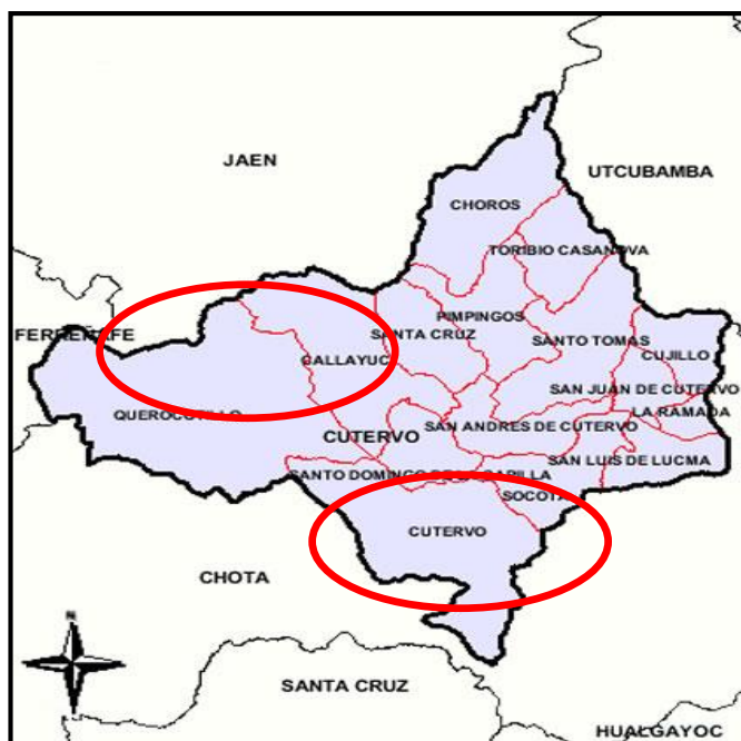
Mapa N° 04: Ubicación Distrital