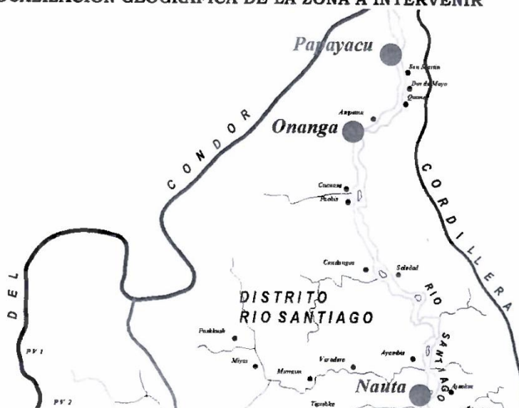
GRAFICO N° 02 LOCALIZACIÓN GEOGRÁFICA DE LA ZONA A INTERVENIR