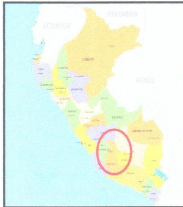
Imagen N°02: Ubicación departamental del proyecto.