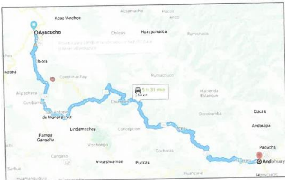
Imagen 01. Tramo 1: Ayacucho – Andahuaylas