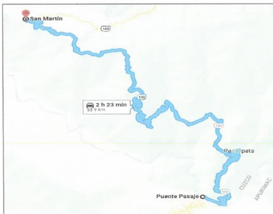
Imagen 04. Tramo 4: Puente Pasaje – C.P. San Martín