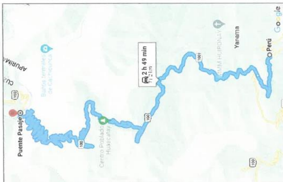
Imagen 03. Tramo 3: Div. Matapuquio – Puente Pasaje