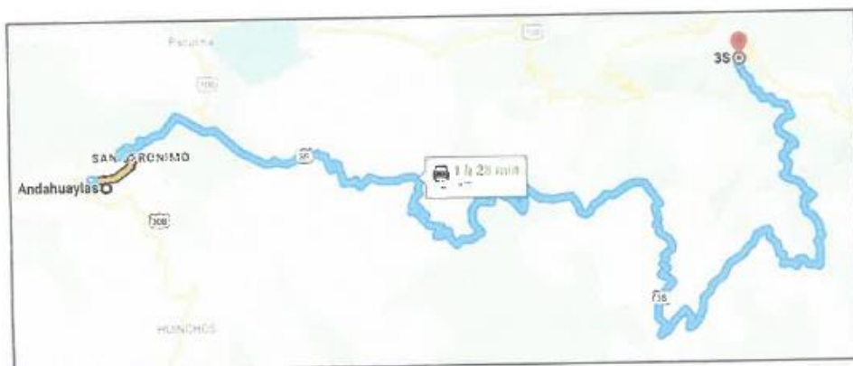
Imagen 02. Tramo 2: Andahuaylas – Div. Matapuquio