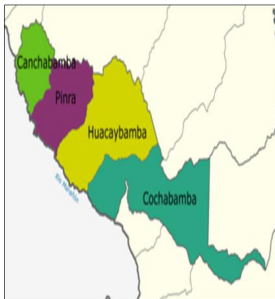
DISTRITO DE HUACAYBAMBA