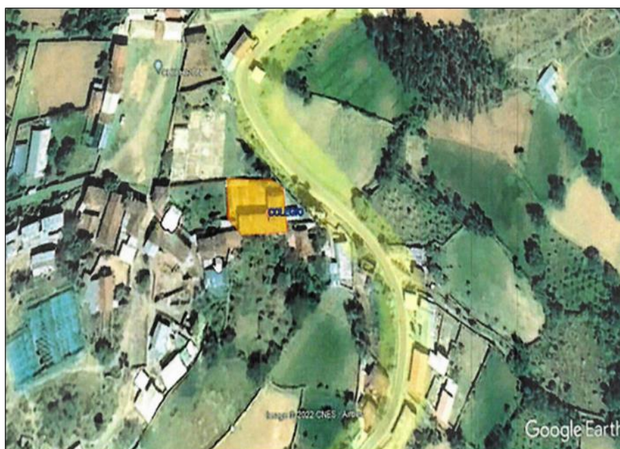
Imagen N° 02: Micro localización de la zona del proyecto