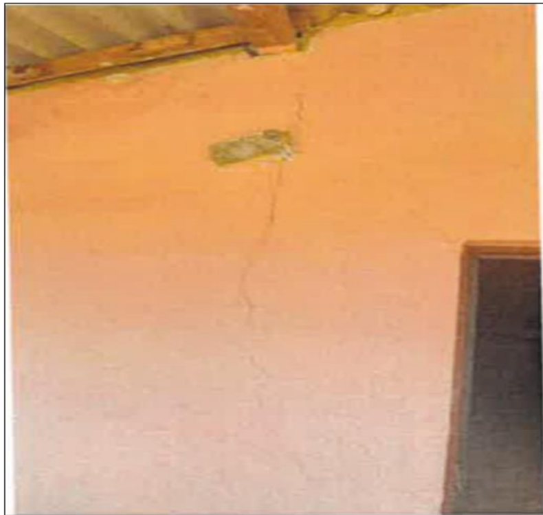
Vista Fotográfica N° 04: Se visualiza las vigas y viguetas de madera