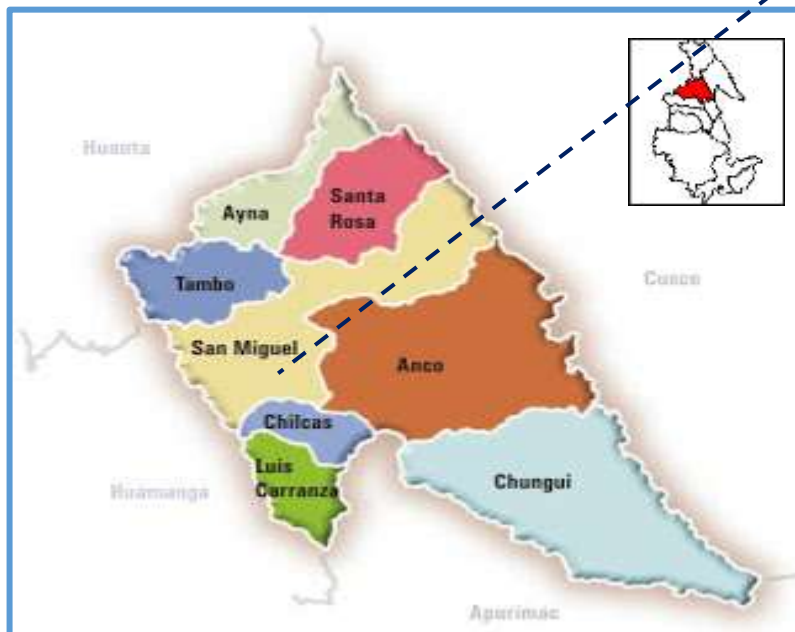
Mapa N° 03: Ubicación Departamental del Distrito

"RENOVACION DE PUENTE PEATONAL EN EL (LA) BARRIO ROSASPATA DEL DISTRITO DE TAMBO, PROVINCIA DE LA MAR, DEPARTAMENTO AYACUCHO"