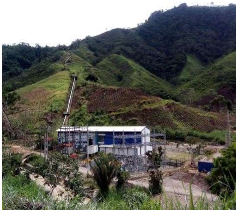
FOTOGRAFÍA 1. Central hidroeléctrica Chalhuamayo.