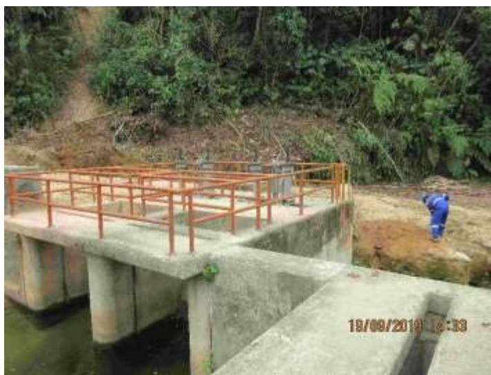
FOTOGRAFÍA 5. Barandas a ser reemplazados y reubicados.