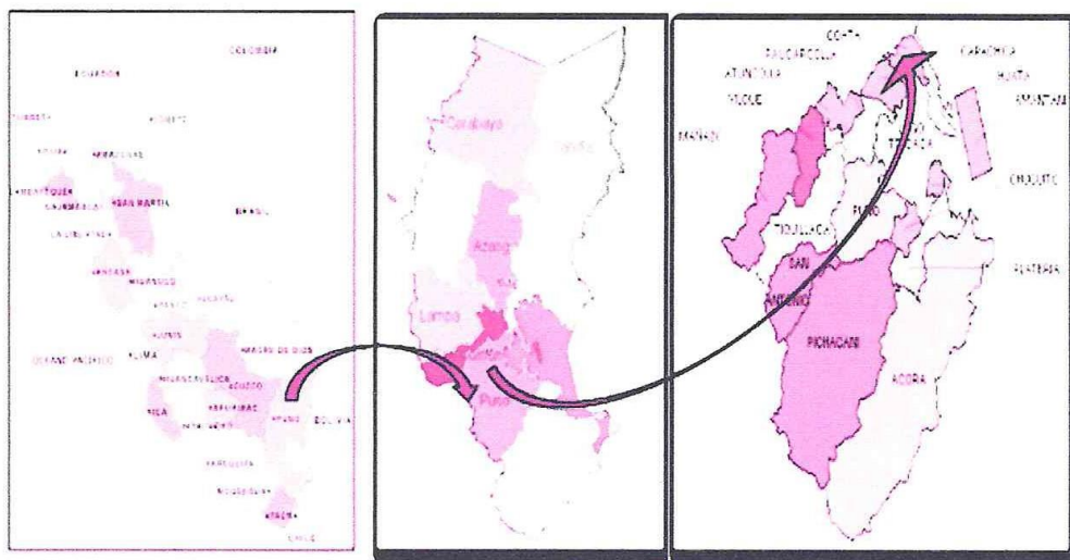
Imagen N° 01: Localización del Proyecto