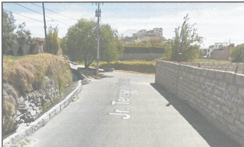
IMAGEN SATELITAL N° 02 VISTA DEL AREA DE INTERVENCIÓN

❖ INICIO: 16°42'28.27''S 71°56'51.13''O FIN: 16°42'45.17''S 71°58'74.40''O