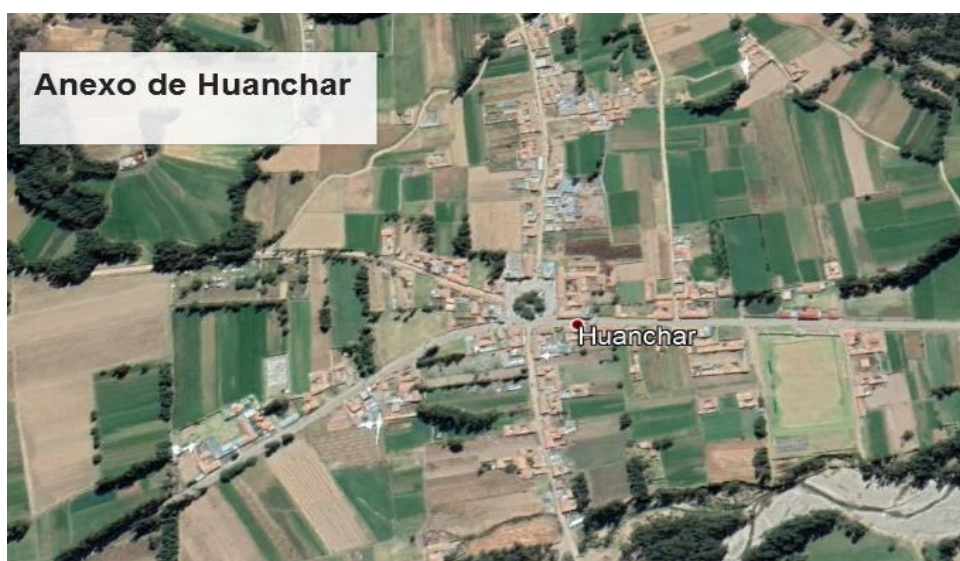
Figura N° 3. Plano localización del proyecto