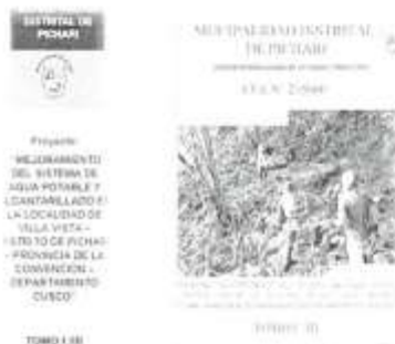
IMAGEN N° 1: FORMA DE PRESENTACIÓN DEL EXPEDIENTE TÉCNICO

Los expedientes deberán ser presentados en archivadores de palanca de lomo ancho. Cada archivador deberá considerar una carátula en la parte frontal y en el lomo del mismo, para una rápida verificación. Se recomienda que dichas carátulas, deberán indicar como mínimo conforme a la figura siguiente: