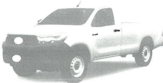
Foto referencial del chasis

Cualquier mejora superior a lo requerido por el área usuaria será verificada y demostrada por la el proveedor.