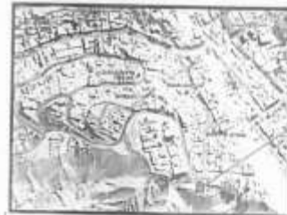
ALMACEN DE OBRA

La entrega del bien se dará en Almacén de obra (Calle 1 - Centro Poblado San Francisco- Provincia Mariscal Nieto, Moquegua. A una cuadra y media del Parque 1ro de mayo. La instalación del bien será en coordinación con residencia