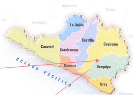
Mapa del Arequipa