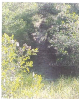
Imagen N°02: Estado actual del canal

Finalmente, con el objetivo de reconocer las necesidades y los intereses de la población objetivo (50 usuarios) se analizaron sus aspectos sociales, culturales y económicos. El objetivo del diagnóstico buscó identificar un listado de problemas y oportunidades en el área objeto del diagnóstico.