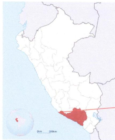
Mapa del Perú

MACROLOCALIZACION (Mapas de localización)