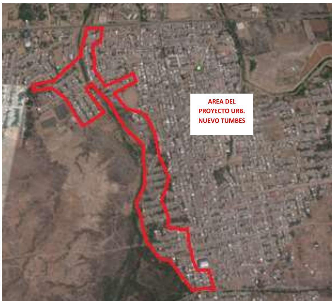
AREA DEL PROYECTO URB. NUEVO TUMBES