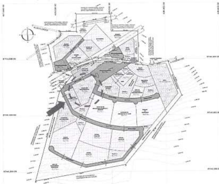
Figura 1 Plano de Ubicación de Servicios Generales en el Plan Maestro de Desarrollo Urbanístico y Arquitectónico de la Universidad Nacional Autónoma Altoandina de Tarma