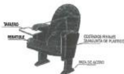
Imagen referencial de diseño-separar:

Los bienes solicitados comprenden las butacas para sala de uso multiple en 1er nivel de la tribuna occidente, y se detallan sus especificaciones técnicas a continuación.