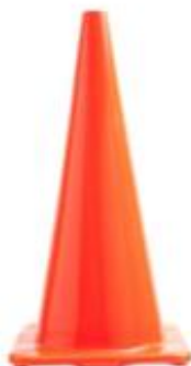
CONO DE SEGURIDAD