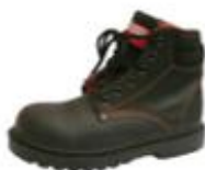
ZAPATO DE SEGURIDAD