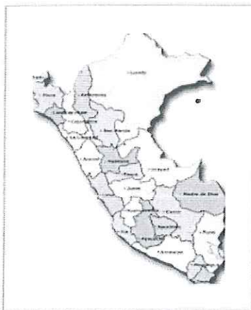
DEPARTAMENTO DE PIURA