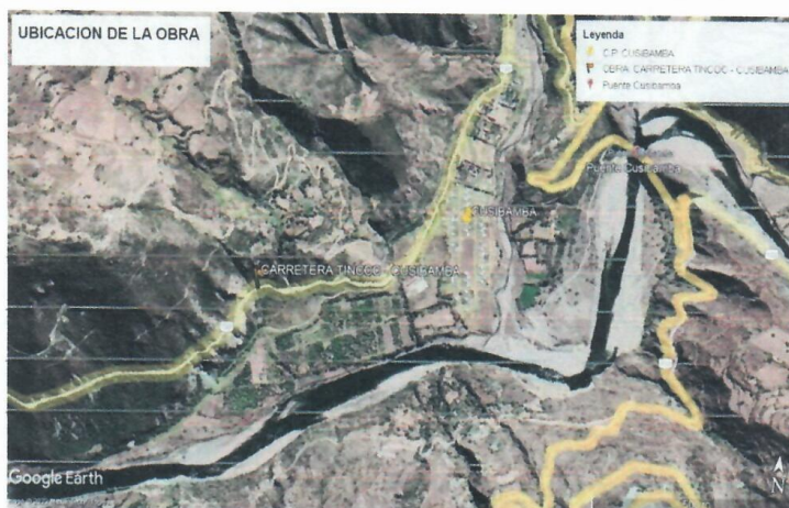
Imagen: Ubicación de la Obra.

La prestación de servicios se dará en la obra: "MEJORAMIENTO DEL SERVICIO DE LA TRANSITABILIDAD VEHICULAR DE LA CARRETERA DEPARTAMENTAL CU-120, TRAMO EMP CU-119 (TINCOC) – EMP. CU 117 (CUSIBAMBA) EN LOS DISTRITOS DE PACCARITAMBO Y PARURO DE LA PROVINCIA DE PARURO - DEPARTAMENTO DE CUSCO".