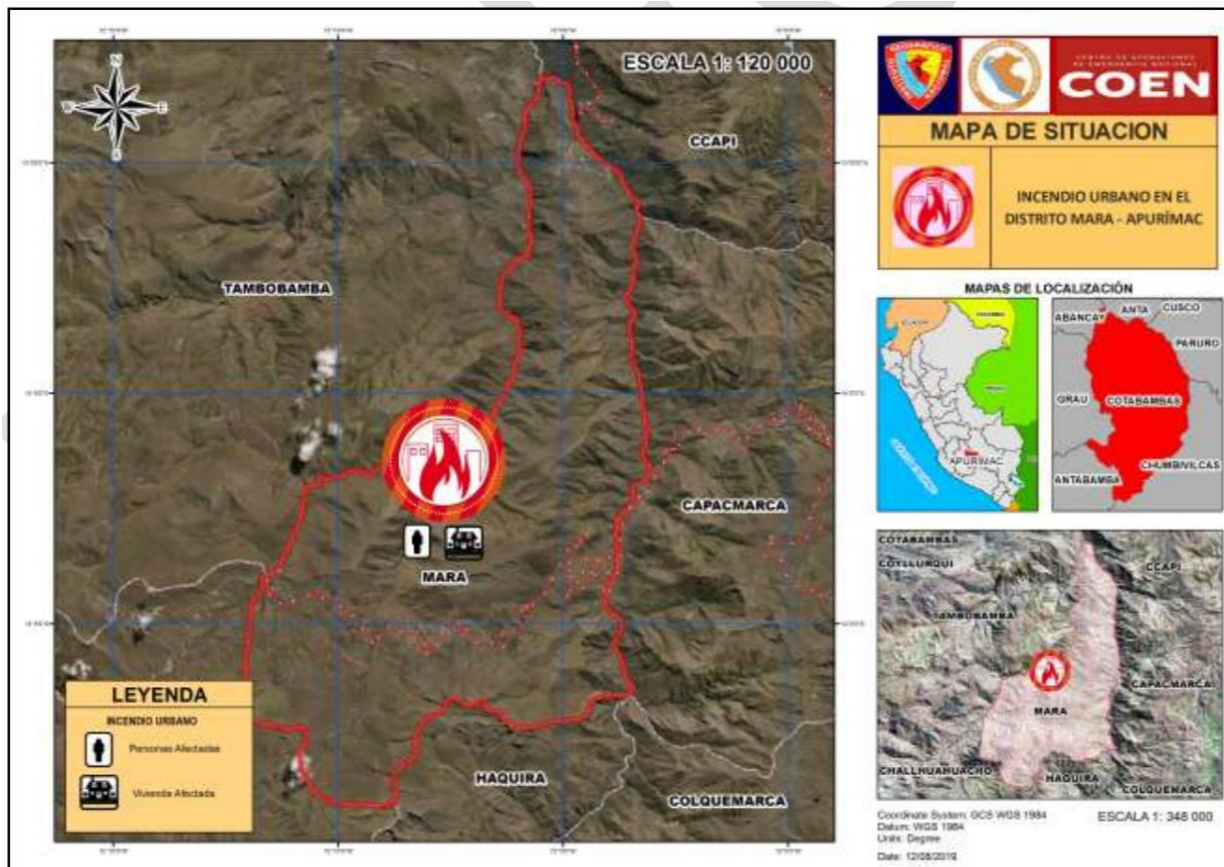
Mapa N°1: Mapa de Ubicación del Proyecto

Sector del Sistema de Riego: -Sector Huarqueray