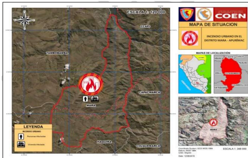
Mapa N°3: Mapa de Ubicación del Proyecto

Los trabajos de campo serán realizados en la ubicación que se detalla líneas arriba; mientras que los trabajos de gabinete, de preferencia deben desarrollarse en la ciudad de Abancay para permitir una supervisión y evaluación concurrentes. Caso contrario se establecerá reuniones virtuales semanales para el control de avance.