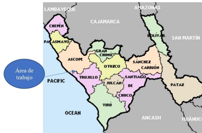
Figura N° 02 Ubicación zona del proyecto