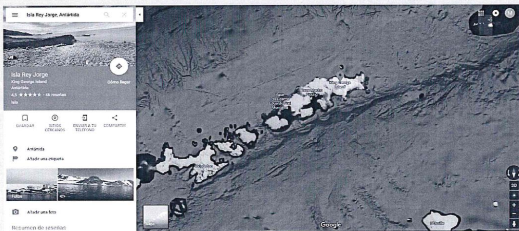
Isla Rey Jorge en la Antártida.

La Antártida es el cuarto continente más extenso del mundo, ubicado en la zona más austral de la Tierra; abarca los territorios al sur del paralelo 60° S, tiene una forma casi circular, de la que sobresale la península Antártica en dirección sur-norte.