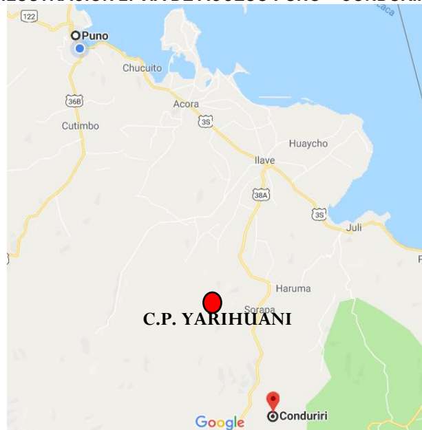
ILUSTRACIÓN 2: VÍA DE ACCESO PUNO – CONDURIRI