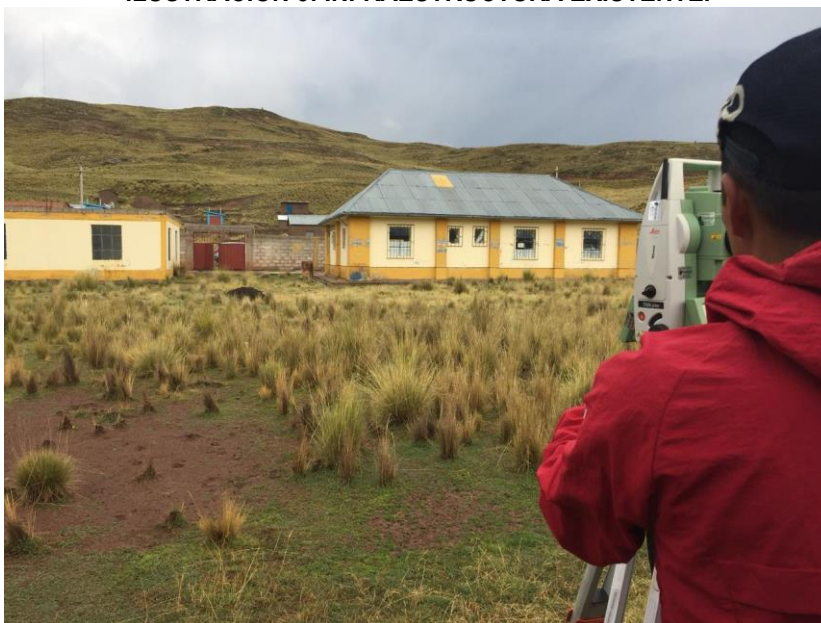
ILUSTRACIÓN 3: INFRAESTRUCTURA EXISTENTE.

El terreno actualmente se ubica un local existente que tiene un área aproximadamente de 212.31 m 2 , tiene una forma rectangular de 4 lados con un perímetro aproximadamente de 34.198 m. El área total del terreno de la posta San Juan de Yarihuani es de 1,643.25.60 m 2 .