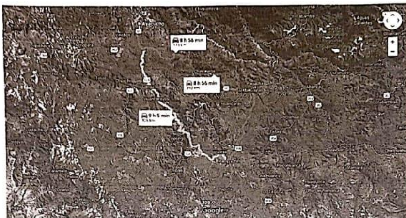
Recorrido de 8 horas y 56 min hasta la localidad de Huataccocha- Chipao-Lucanas.