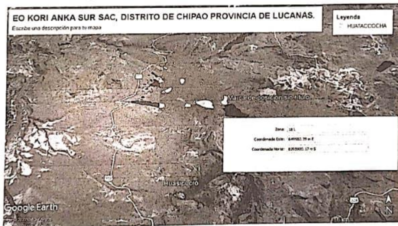
Imagen del centro poblado del AEO con Coord. UTM