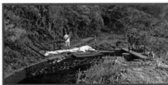
Paso del canal Amojao y toma de agua que ingresa a la actual planta de tratamiento de la localidad de Bagua.

Se cuenta con una población total de 24,780 habitantes, 12,098 hombres y 12, 682 mujeres. El 12.31% de pobladores no sabía leer ni escribir.