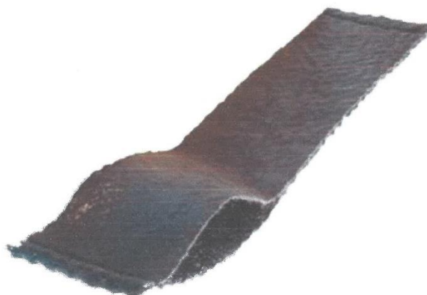
Figura N° 01 – Geocompuesto de drenaje Vertical – Sección

Es un geocompuesto para drenaje liviano y flexible, cuyo núcleo drenante es formado por una geomanta tridimensional, fabricada con filamentos de polipropileno y termosoldada entre dos geotextiles no tejidos en todos los puntos de contacto, excepto en la región para la inclusión del tubo perforado. Será especialmente desarrollado para su uso en obras de carreteras, trincheras drenantes, estacionamientos, y sistemas donde requiera un subdrenaje vertical. Este drenaje sintético será capaz de capturar, conducir y drenar el exceso de agua de la lluvia, sistemas de riego, la reducción del nivel freático, etc. con la máxima eficiencia y velocidad, acorde a las características técnicas, económicas y constructivas sobre los sistemas convencionales.