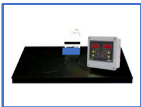
Balanza electrónica dúo