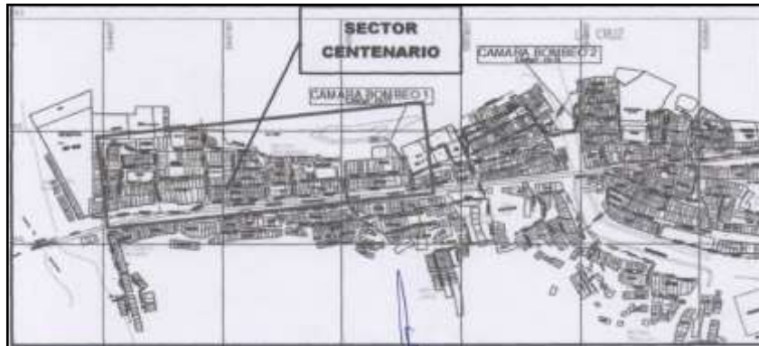
ESQUEMA DEL AREA DE INFLUENCIA DEL ESCENARIO A INTERVENIR CON RESPECTO DEL PIRCC