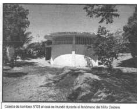
Casetta de bombeo N°03 al cual se inundó durante el fenómeno del Niño Costero