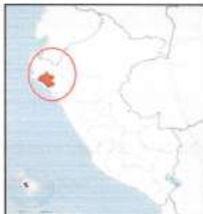
Figura 01: Mapa Departamental del Perú - Lambayeque.

Departamento : Lambayeque Provincia : Chiclayo Distrito : José Leonardo Ortiz