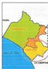
Figura 02: Mapa provincial de Lambayeque.