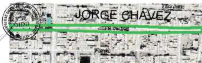
Figura 04: Avenidas a intervenir en el Distrito de José Leonardo Ortiz