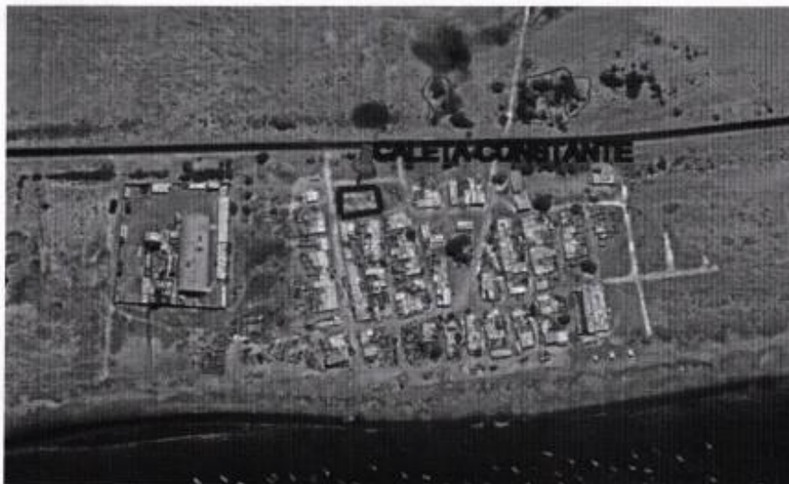
Vista Satelital de la Caleta Constante

NORTE : N-9372616 ESTE : E 516692 Altitud : 2 m.s.n.m. Región Natural : Costa