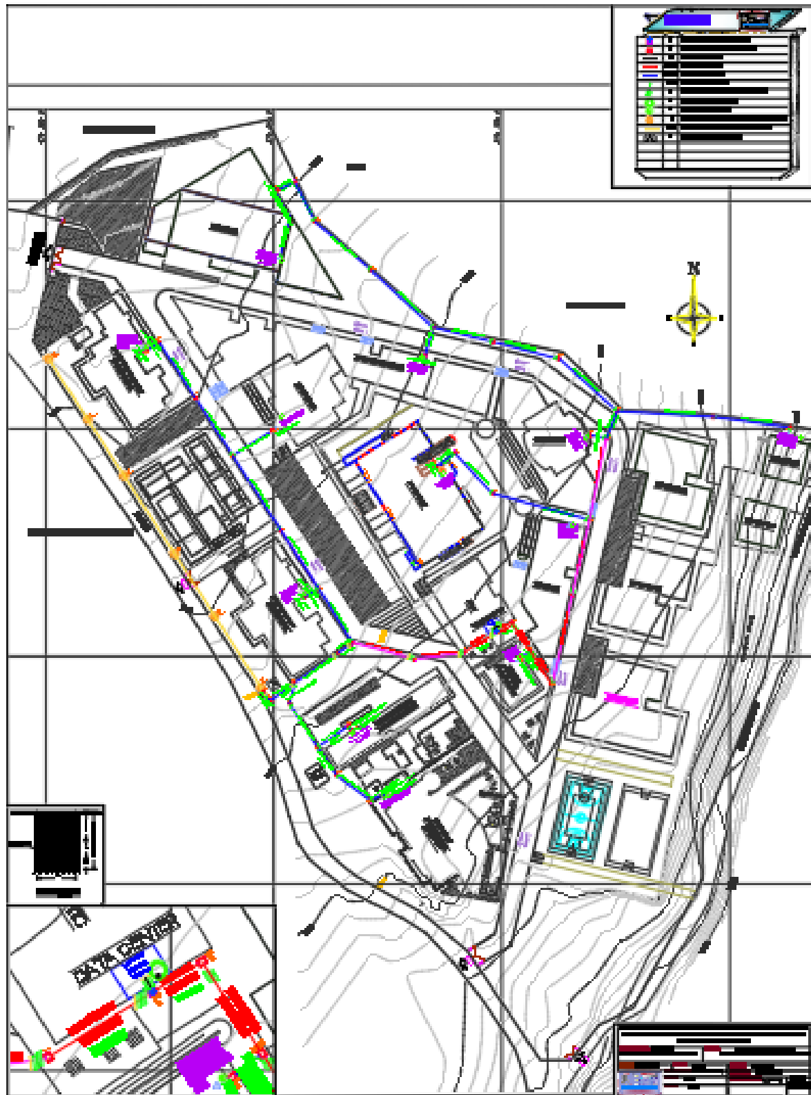
PLANO GENERAL DE SISTEMA DE FIBRA ÓPTICA PROYECTADO