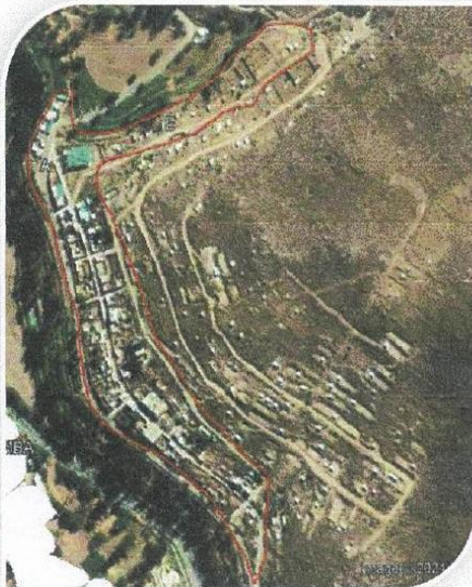
Imagen 3: Área de influencia Pueblo de Belaunde