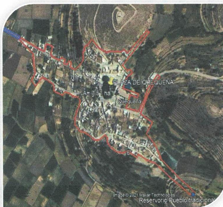
Imagen 2: Área de influencia Pueblo de Quequeña