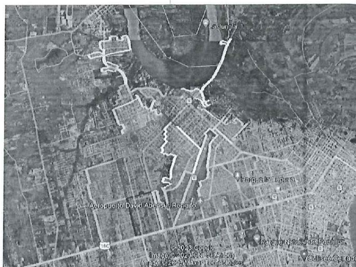
24 Zonas de recolección