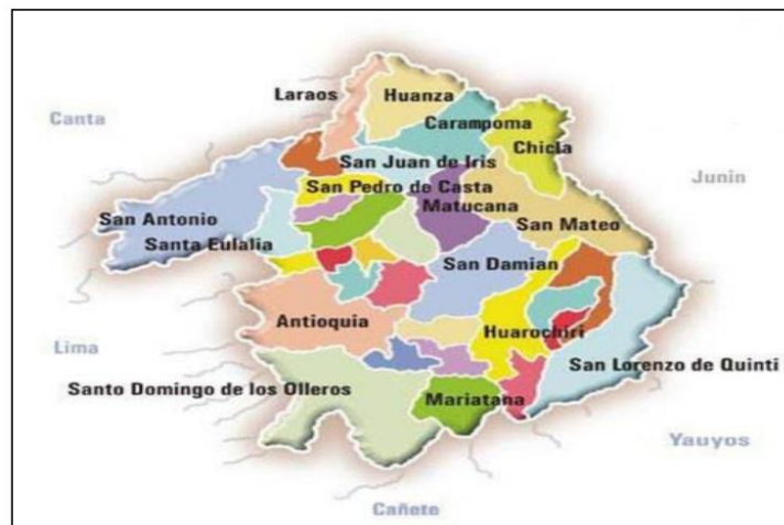
Fig. N° 01: Ubicación de las zonas del proyecto.

Departamento : Lima. Provincia : Huarochiri Distritos : Varios. Localidades : Varios.