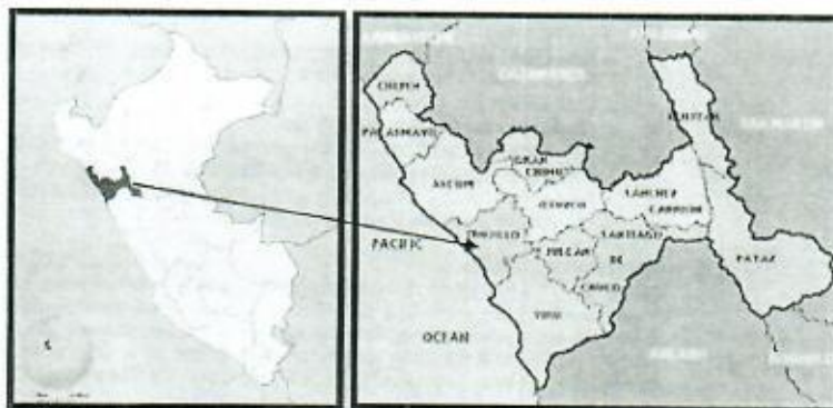
Imagen 01-06: Localización