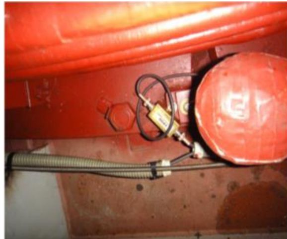
Gráfico N° 1.- Vista de los acopladores del sistema de monitoreo de descargas parciales montados en el bus del estator, así como el cable y conector a tierra.