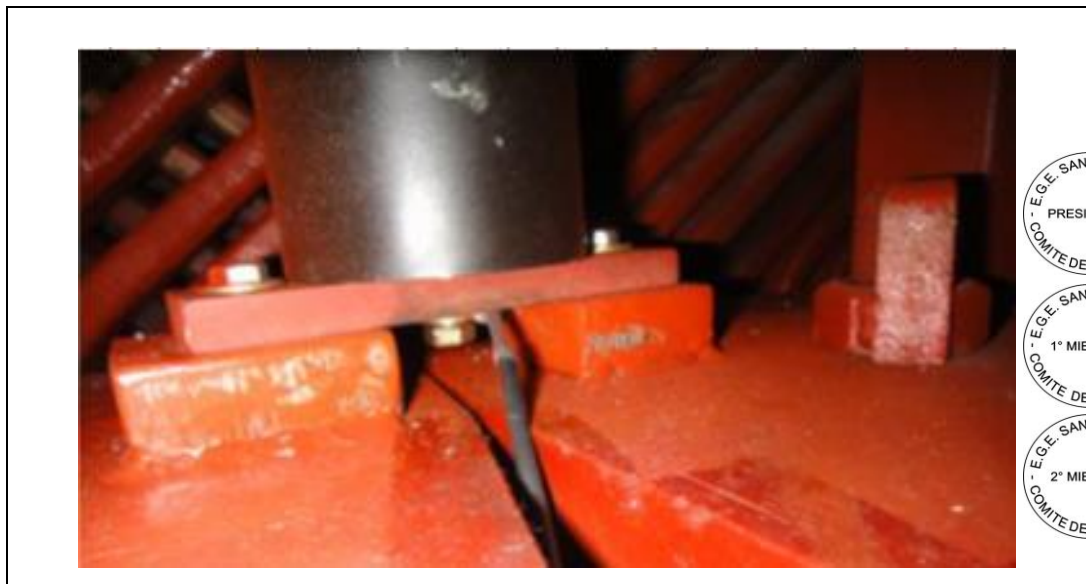
Gráfico N° 1

Los acopladores están montados sobre el estator en un espacio de la barra anillo, tiene conexión de alta tensión con protección anti corona con cinta semiconductor más resina y conexión a tierra de alta frecuencia con conectores SGA tal como se visualiza en el gráfico N°1.