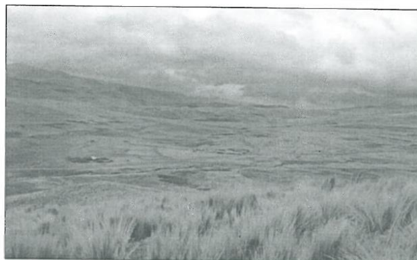
Imagen N° 3 – Vista de la comunidad de Huancané

La brecha de calidad de Brecha Calidad de agua para el proyecto se tiene los siguientes: