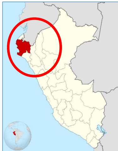
Ubicación Departamento Piura